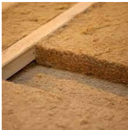
STEICOFLEX - Fibre de bois

Les deux types de panneaux d'isolation rigides peuvent être utilisés pour l'isolation extérieure des toits et des murs à ossature en bois, sur des murs en maçonnerie solide, ou en isolation intérieure, directement contre la maçonnerie. La paraffine ajoutée leur confère un certain degré de résistance aux intempéries (jusqu'à 3 mois d'exposition aux intempéries).