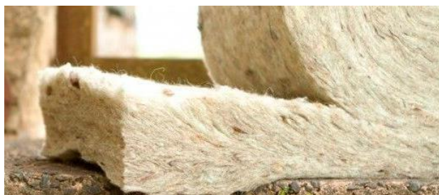
ArchiExpo - Isolation en laine de mouton

L'isolation en laine de mouton utilise de la laine de mouton « grossière » combinée à d'autres fibres pour créer une isolation thermique et acoustique matelassée. La laine de mouton n'est pas utilisée pour la fabrication d'isolants rigides ou soufflés en vrac. Les laines « grossières » sont les mieux adaptées à l'isolation en raison de leur faible valeur économique et de leur densité plus importante.