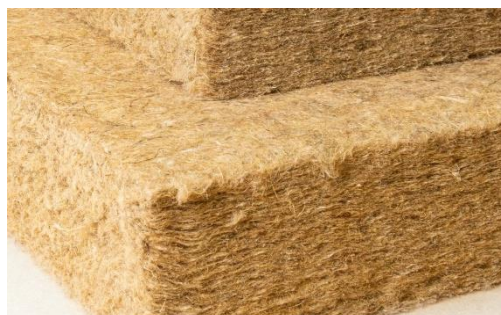
Systèmes de construction écologiques - Isolation en fibres de chanvre et de jute

L'isolation en chanvre est fabriquée de la même manière que le lin : les fibres techniques 36 sont séparées de l'anas des tiges du chanvre. Les fibres de chanvre techniques sont ensuite mélangées avec des liants et d'autres fibres (fibres de polyester) pour produire l'isolant.