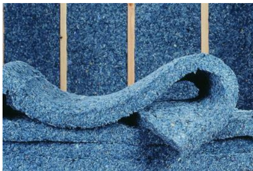
BUILDDIRECT -Denim Insulation

L'isolation en coton est constituée d'un mélange de fibres de coton (75 - 90 %) et d'un liant bi-composant en polyester (PET) (10 - 25 %). La principale source de coton provient du denim qui a été reconstitué en fibres libres. Les déchets de coton de pré-consommation sont largement utilisés dans la literie où ils sont mélangés à un liant bi-composant en polyester 33 pour produire de la ouate utilisée comme composant de matelas. La fabrication de l'isolation en coton fait appel à cette technologie et constitue une extension naturelle de ces applications conventionnelles.