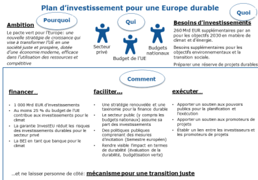
Graphique 2. Le plan d'investissement pour une Europe durable

Le plan d'investissement pour une Europe durable contribue à la réalisation des objectifs de développement durable. Cela correspond à l'engagement pris dans la communication relative au pacte vert pour l'Europe de placer les objectifs de développement durable au centre de l'élaboration des politiques de l'UE et de l'action de celle-ci.