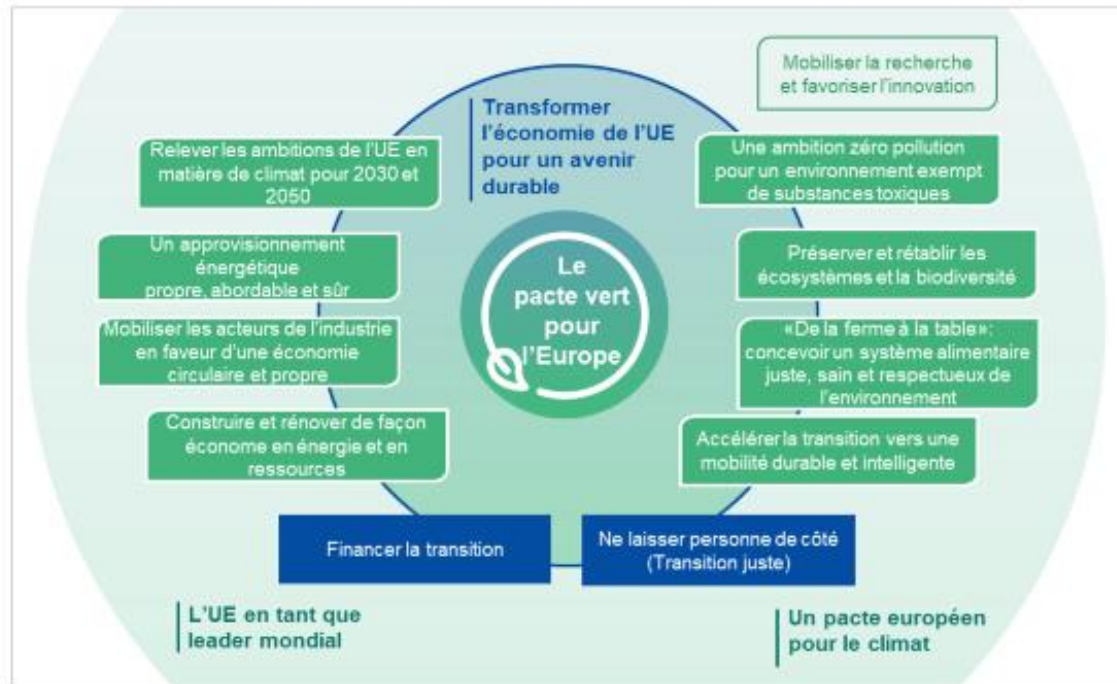
Graphique 1. Le plan d'investissement au sein du pacte vert pour l'Europe

Le plan d'investissement pour une Europe durable permettra d'accomplir la transition vers une économie verte et neutre pour le climat selon les trois axes suivants: