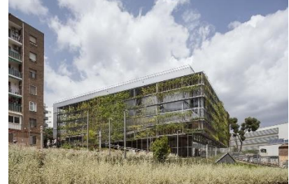
Turo de la Peira – ©Enric Duch