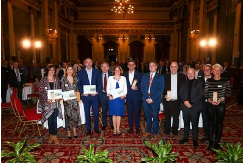
Les lauréats internationaux à la remise des prix à Glasgow en présence de Barbara Pompili, alors ministre de la Transition écologique